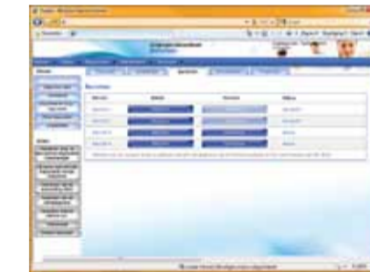
Verwerking binnengekomen berichten