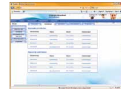
Activiteitenoverzicht (gepland en afgerond)